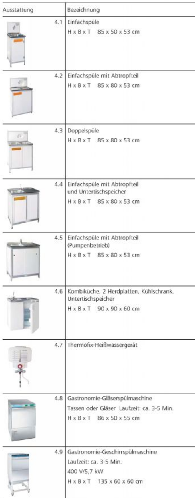
Illustration der Mietgeräte